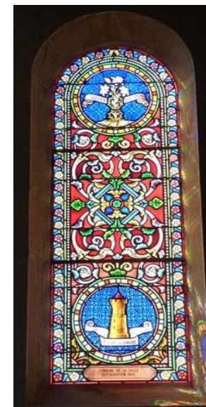
Litanies de la Vierge