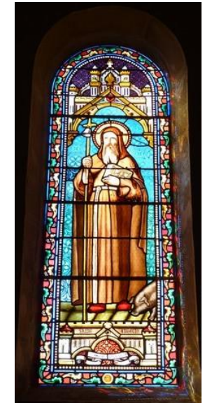
St Antoine et son porc